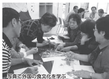
写真で外国の食文化を学ぶ