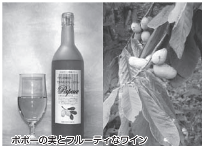
ポポーの実とフルーティーなワイン

れました。また、ポポーの香りと甘みを活かした製品作りの努力が実ってアイスクリームや、洋菓子なども商品化されています。