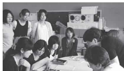
写真選びもなかなか大変(大久保小)

紙面をもとに、読みやすいレイアウトの仕方や写真の配置をはじめ、読む人をひきつける見出しの付け方な