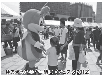
ゆるきゃら®と一緒に (フェスタ2012)

合いを通してその活動も紹介します。子どもたちに大人気の「日立のゆるきゃら®」たちも登場して、子