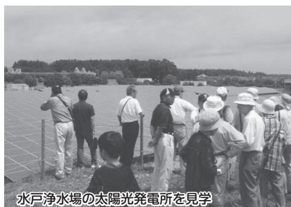
水戸浄水場の太陽光発電所を見学

場・ハイブリッド発電機組立工場です。重電機工場の見学は初めてで、ヘルメット・ゴーグルをつけての見学に一同緊張しました。