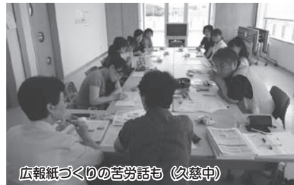
広報紙づくりの苦労話も(久慈中)

報委員会としての視点についても話し合わせ、地域の特性を生かす記事の工夫などがあげられました。広報紙づくりへの熱意が伝わってきた両校、いい広報紙ができそうです。