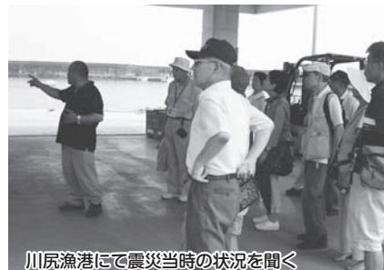
川尻漁港にて震災当時の状況を聞く

参加者からは、「未来に向かって着々と復興が進んでいることを実感できた」「自分たちの未来に、子や孫のために、今何が出来るかを考え