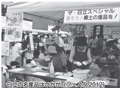
日立の名産品はいろいろ (フェスタ2012)

新都市広場では、日立のブランド品の展示・販売、地元産のおいしい食べ物が並ぶテントや日立生まれの